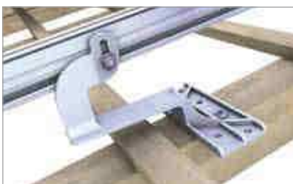
Dachhaken mit Höhenverstellung N-Schiene