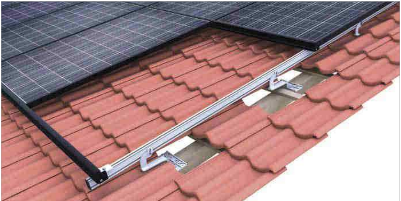
novotegra side-fix – Einlegesystem mit hochkant montierten Modulen