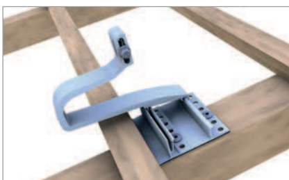
Position Grundprofil am Sparren