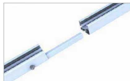
Verbinder C-N-Schiene 37