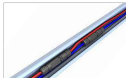
C-N-Schiene als Kabelkanal