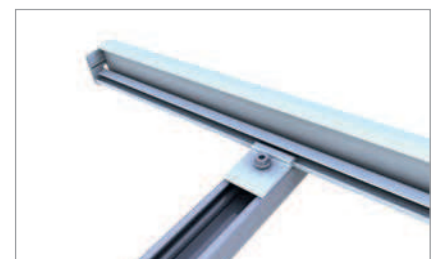
Einlegeschiene auf C-N-Schiene