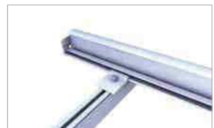
Einlegeschiene auf N-Schiene